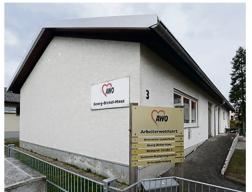
Gute Nachricht von der Arbeiterwohlfahrt (AWO) in Laudenbach: Mit 404 Mitgliedern hat der Verein seinen historischen Höchststand erreicht.

Viele Eltern haben sich entschlossen, die Arbeit der Arbeiterwohlfahrt durch eine Familienmitgliedschaft zu unterstützen, wobei sie daraus auch den Vorteil ziehen, bei der Vergabe der begehrten Plätze auf eine Vorabreservierung bauen zu können. hb