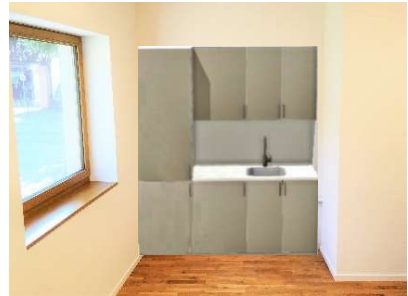
... und so könnte er aussehen

Bald startet unsere Jugendarbeit in Laudenbach wieder, einen schönen Raum haben wir im neuen Gemeindehaus, ein bequemes Sofa, Sitzgelegenheiten, Tische und Tischkicker sind auch schon da. Was fehlt: ein Schrank zur Unterbringung unserer Utensilien, eine Gelegenheit, einen Tee zu kochen oder ein paar kühle Getränke zu lagern.