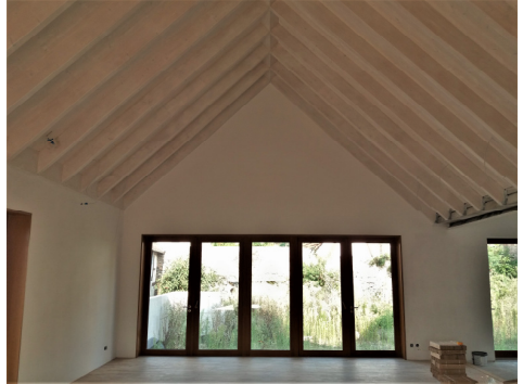
Blick in den Gemeindesaal

Von außen gesehen tut sich nicht viel am Gemeindehaus, doch innen schreiten die Arbeiten voran: der Parkettboden sowie die Boden- und Wandfliesen sind nahezu vollständig verlegt, die Elektroarbeiten sind weitgehend abgeschlossen. Die derzeitigen pandemiebedingten Probleme bei der Lieferung von Holzbauteilen konnten auch gelöst werden, die Vergabe für die Schreinerarbeiten (Türen, Systemtrennwand und Einbauschränke) sind zwischenzeitlich erfolgt. Leider legen sich die Firmen nicht mehr vertraglich auf Liefertermine fest, so dass ein Fertigstellungstermin immer noch nicht sicher genannt werden kann.